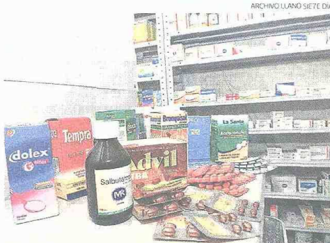
Los consumidores compran los medicamentos según su presupuesto.

La evaluación se hizo in vitro, método utilizado para evaluar la capacidad antimicrobiana, y las muestras revelaron la misma potencia “por lo tanto no se pue-