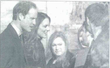
No se han hecho anuncios sobre la amenización en vivo para la fiesta que ofrecerá el príncipe Carlos en el palacio, luego de la recepción de la reina, y a la que estarán invitados amigos íntimos de Guillermo y su prometida.