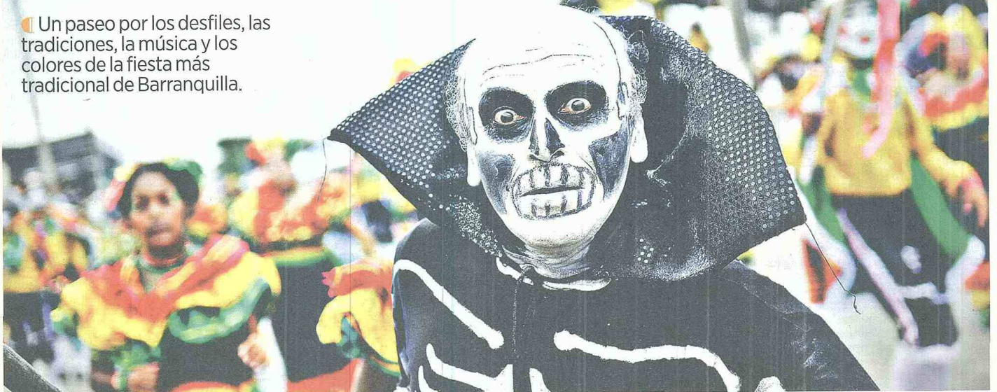
La muerte, personaje recurrente en las paradas del Carnaval. En total se presentaron más de 700 comparsas.

Un paseo por los desfiles, las tradiciones, la música y los colores de la fiesta más tradicional de Barranquilla.