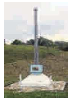
El evento es en el monumento

● Como parte de la celebración del Bicentenario de la Independencia, el próximo 2 de abril se realizará un acto protocolario para conmemorar la Batalla del Bajo Palacé.