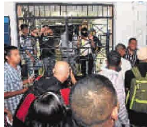
Estudiantes protestaron en el edificio de rectoría. Piden cambios.

Ayer, el Consejo Superior se abstuvo de dar declaraciones.