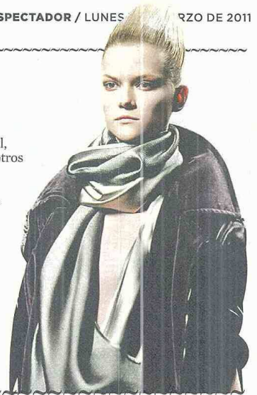
Prenda diseñada por Haider Ackermann y presentada en la Semana de la Moda de París.

Vaporosos vestidos en satén, seda y piel, algunos con un hombro al descubierto, otros con el muslo al aire libre y profundos escotes caracterizaron la propuesta de este diseñador, que tras la salida de John Galiano suena como su más seguro sucesor en la casa Christian Dior.