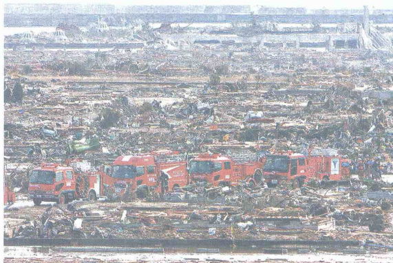
Un convoy de vehículos de emergencia atraviesa los escombros de un sector de la ciudad de Natori, una de las más golpeadas por el desastre del viernes. En esta ciudad empezaron a circular los primeros autobuses públicos.

El viaje hacia Tokio, que en el tren bala o 'Shinkansen' dura hora y media, ahora tarda dos días. Dice que ya no hay vehículos particulares disponibles y que de haberlos, el servicio sería muy costoso y