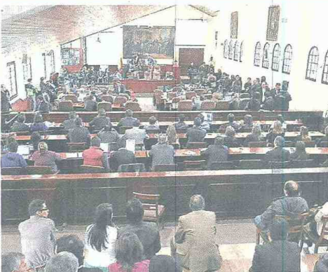
Concejo decidirá si Armella asume temporalmente el cargo. ADN