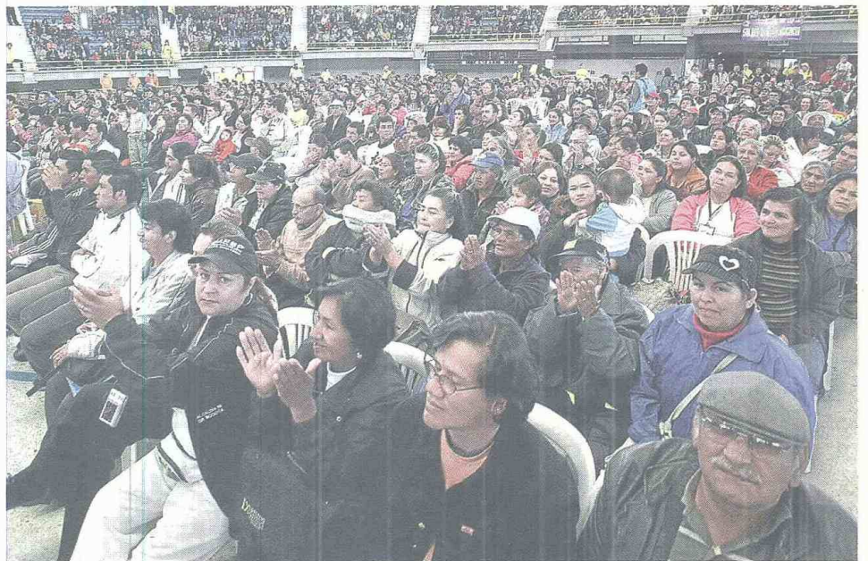
Los más de 11 mil recicladores censados participaron de una mañana en la cual compartieron con sus colegas.