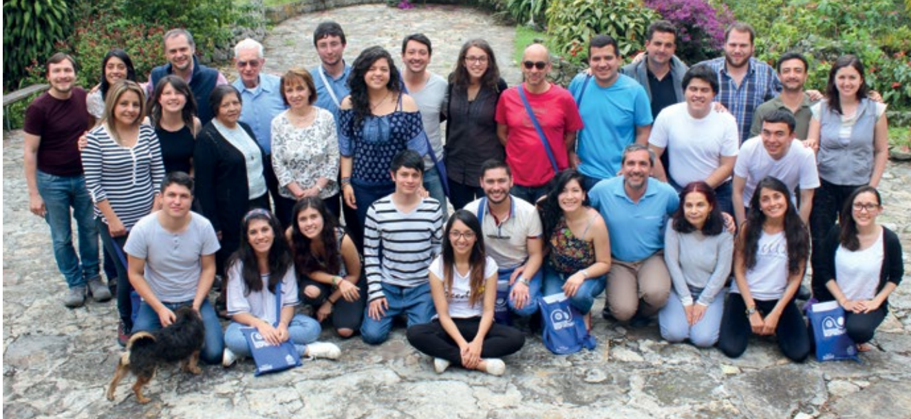
↑ Grupo de participantes en los Ejercicios Espirituales organizados por el Centro Pastoral San Francisco Javier.