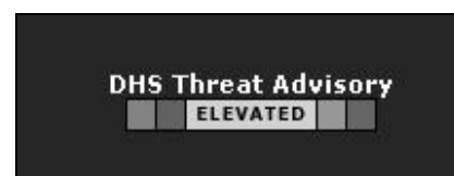
Ready.gov (Junio 2006)

En este caso el "temómetro" que indica en la página de inicio el grado de alerta (del verde al rojo, pasando por toda una gama de emergencias) cumple una función meteorológica presente en muchos diarios digitales (Ver Fig. 4).