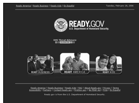
Ready.gov (Marzo 2006) Figura 1

Los objetivos del sitio son explícitos: “educar al público en forma permanente sobre cómo prepararse en caso de una emergencia nacional, incluyendo la posibilidad de un ataque terrorista”. Como se puede observar, sobre las imágenes interactivas que conducen a las tres secciones se destaca un ‘termómetro’ que indica el nivel de alerta terrorista de los Estados Unidos.