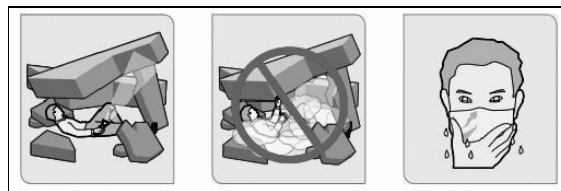
Ready.gov (junio 2006)

Como ejemplo de esta inexpresividad podemos mencionar los ya tradicionales folletos de aviones donde se describen situaciones de riesgo. Todos los folletos de Ready.gov imitan ese estilo neutral, que desvincula el dolor y la angustia de las facciones de la cara (ver Fig. 3).