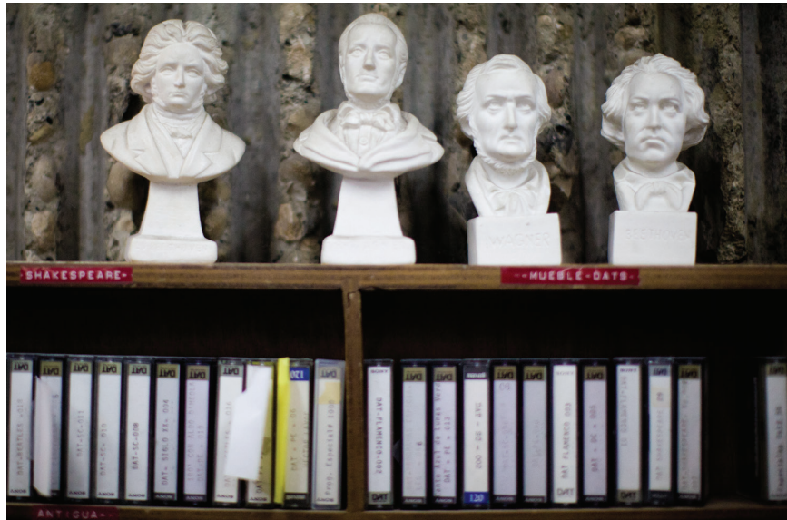
Las universidades buscan crear proyectos radiales independientes que puedan ser una opción de calidad.

■ “LO QUE SE HA DETECTADO ES QUE LA ESCUCHAN PERSONAS DE LOS ESTRATOS MEDIOS Y ALTOS EN BOGOTÁ QUE BUSCAN UNA OPCIÓN POCO COMERCIAL QUE CUIDE JUICIOSAMENTE EL CONTENIDO QUE PONE AL AIRE”.