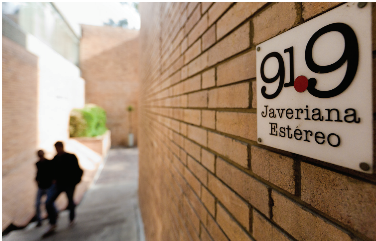
La programación de Javeriana Estéreo incluye programas musicales, educativos, académicos y de divulgación.