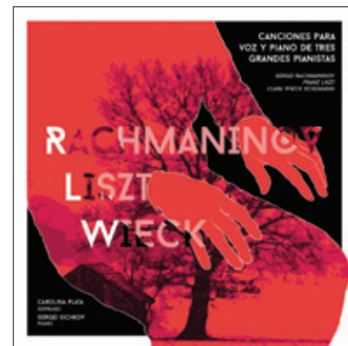
Canciones para voz y piano de tres grandes pianistas, producto final de la investigación.

De un repertorio vocal estándar a uno poco conocido que reivindica el trabajo para voz y piano de tres grandes intérpretes, fue la apuesta de tres profesores javerianos de la Facultad de Artes del Grupo de Investigaciones Musicales.