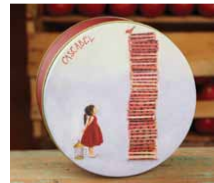
Pasión y libertad La niña y el pajarero.