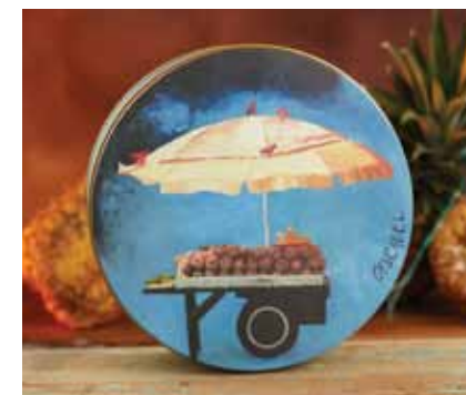
Prosperidad La sombrilla cubriendo la venta de piñas.

La colección mercado ha sido creada como un tributo a las plazas de mercado colombianas y hace alusión a las costumbres, supersticiones y creencias de nuestro imaginario colectivo.