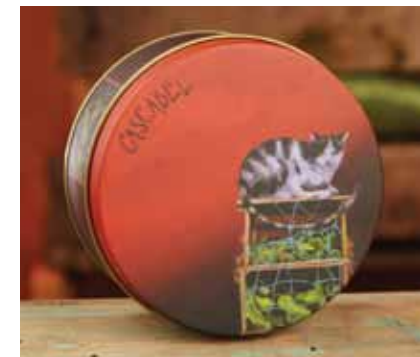
Suerte El gato callejero.