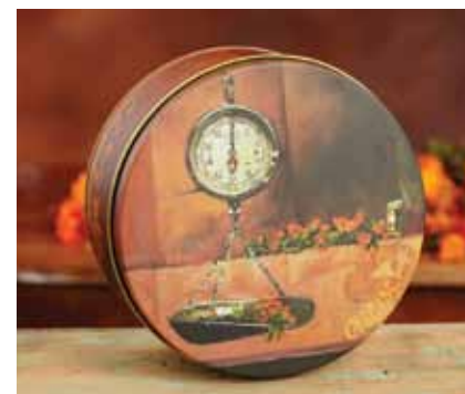
Salud La mano milagrosa de José Gregorio Hernández.