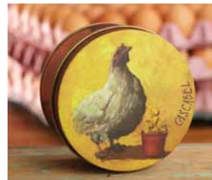
Fortuna La gallina de los huevos de oro.