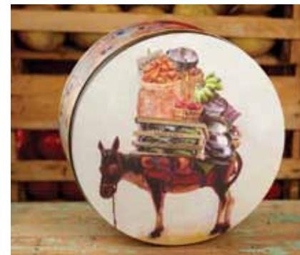
Cambios El burro carguero.