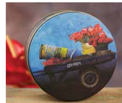
Anturios Carreta con venta de flores.