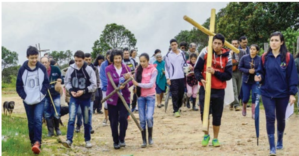
↑ Realización del Santo Viacrucis – Diutama, Boyacá.

Uno de los rasgos más significativos e identitarios del quehacer de la Compañía de Jesús a lo largo de su prolífica historia ha sido el deseo inconmensurable de salir al encuentro fraterno de las comunidades periféricas que habitan en los confines de nuestros pueblos.