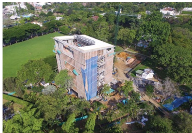
→ Cali Design Factory, nuevo edificio de Javeriana Cali donde estará el laboratorio de innovación y emprendimiento de Campus Nova.