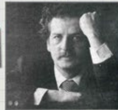
Primera candidatura presidencial

Concejal de Oiba Senador de la República Concejal de Bogotá