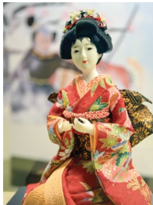
↑ Figura de la exposición 'Las muñecas del Japón' que representa el baile "Shikumi" (recogiendo agua del mar).

Japón fue el país invitado de la X Semana Internacional Javeriana que, con muestras de sus principales tradiciones, conferencias e invitados especiales, se tomó la Universidad del 22 al 25 de octubre.