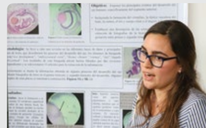
En el Congreso de este año, los semilleros de investigación fueron protagonistas en los simposios y jornadas de pósters.