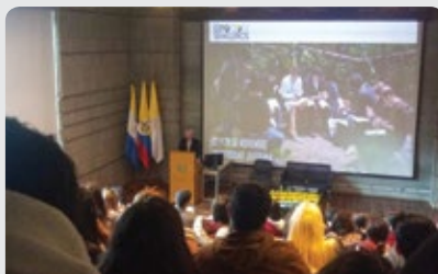
El trabajo colaborativo entre semilleros de investigación fue una de las apuestas de la segunda edición de Exposemilleros.