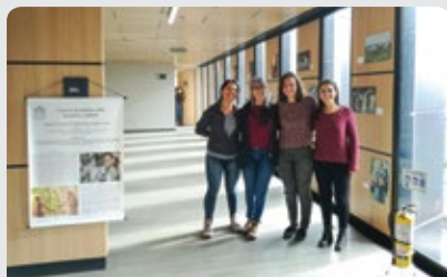
El semillero 'Colectivo de estudios sobre memoria y conflicto' fue una de las estaciones en el Tour de la Investigación en el Congreso de 2017.