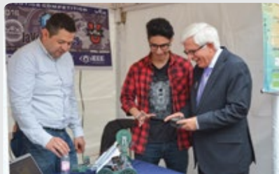
Cerca de 50 semilleros presentaron durante dos días en Exposemilleros sus actividades a la comunidad javeriana.