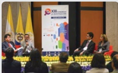
Primer simposio de semilleros en la historia del Congreso La investigación en la Pontificia Universidad Javeriana.