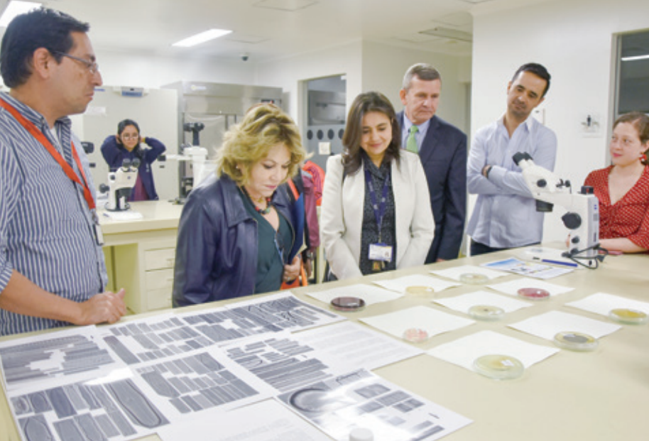
Los pares académicos observando las colecciones biológicas en la Facultad de Ciencias, durante su visita al campus de Javeriana Bogotá.