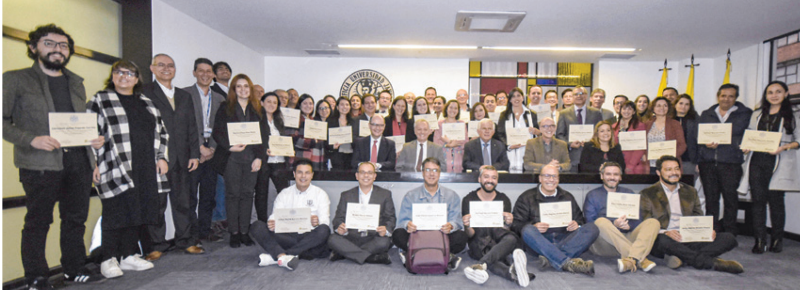
↑ Participantes de la cohorte número 11 de Cardoner que finalizó el 20 de noviembre de 2019.

que profesores y administrativos asisten a conferencias presenciales con profesores de la propia Universidad, de otras universidades del país e invitados internacionales; talleres y grupos de interés en los que se reflexiona sobre aspectos de la vida universitaria siguiendo la metodología del estudio de casos. Además, cada participante tiene un acompañante con quien dialoga sobre lo vivido en el programa y se cuenta con un compo-