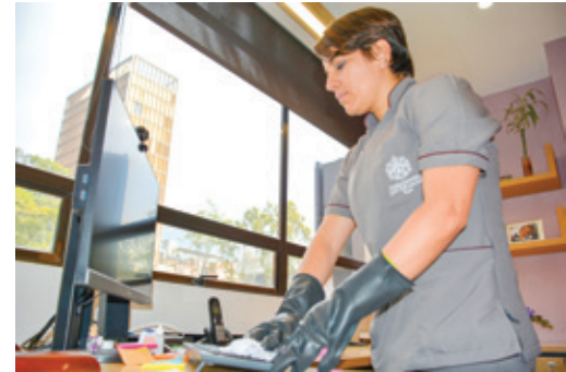
Las conserjes de la Javeriana limpian y desinfectan las áreas comunes de la Universidad, puertas, manijas, mostradores en cafeterías y lugares de trabajo al rededor de tres a cuatro veces al día.

con todas las medidas de seguridad. Ellos son el personal de seguridad, de aseo, servicios de alimentación y mantenimiento.