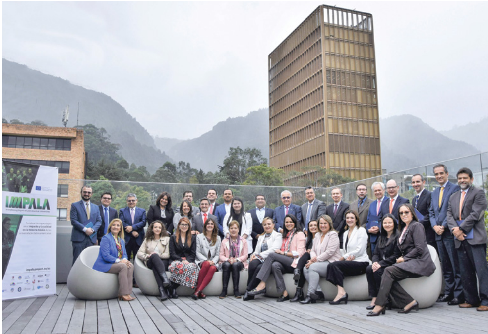
Presentación del proyecto IMPALA a los altos directivos de las instituciones socias colombianas en la Javeriana el 17 de febrero de 2020.

La Javeriana hace parte de las 19 instituciones latinoamericanas y europeas que participan en el proyecto de cooperación internacional IMPALA, cofinanciado por la Unión Europea a través del programa ERASMUS+.