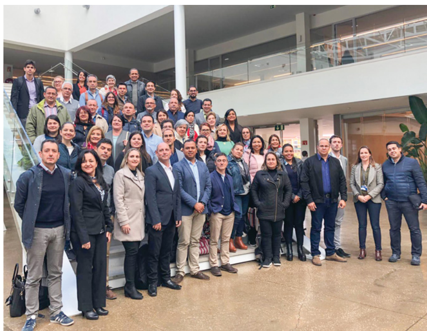
Entrenamiento para 'top managers' sobre la aplicación práctica del IAF de Nova School of Business and Economics, Universidade NOVA de Lisboa, Portugal. Marzo 4 al 6 de 2020.