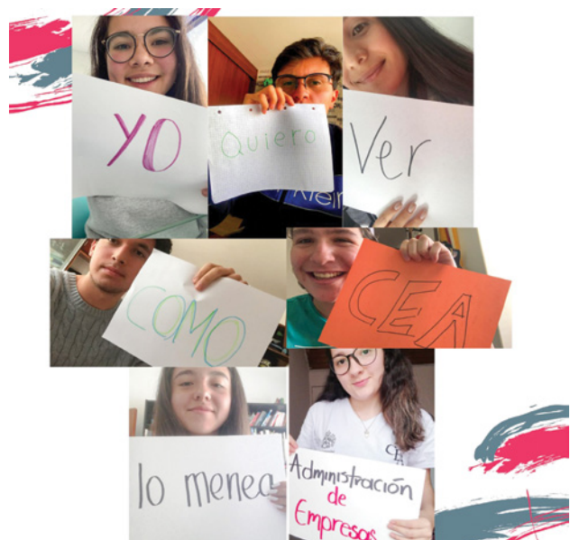
Neojaverianos de la Facultad de Ciencias Económicas y Administrativas.

* Periodista de la Dirección de Comunicaciones