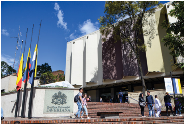
La Pontificia Universidad Javeriana es la primera Institución de Educación Superior del país en contar con el registro internacional de su marca ante la Organización Mundial de la Propiedad Intelectual.

Dirección de Innovación, enfatizó que la Universidad ha consolidado un amplio portafolio de patentes a nivel nacional e internacional para respaldar los procesos de transferencia de tecnología y conocimiento, aportando valor con el propósito de que los resultados de investigación generados en la academia, contribuyan a resolver los retos y necesidades que enfrenta el país y el mundo.