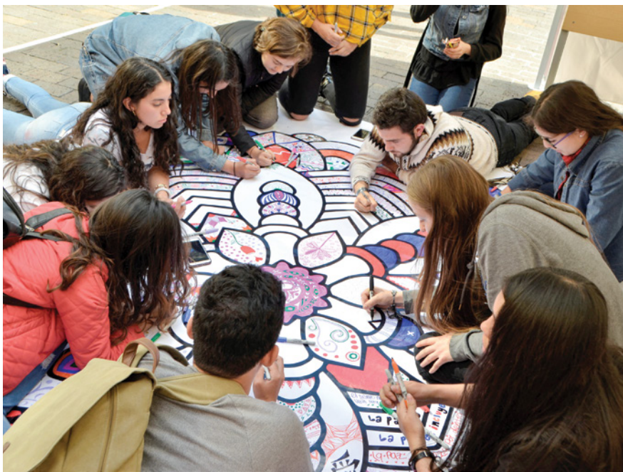
Este año el afiche por la paz se pintará de forma digital.

es fundamental para combatir la guerra en la que han muerto miles de colombianos inocentes”.