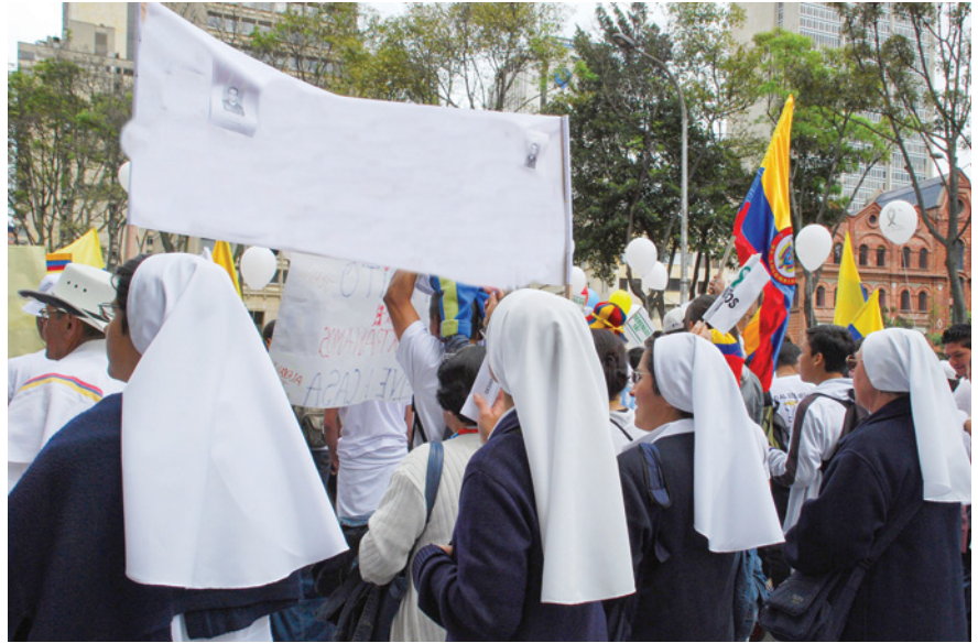
La Semana por la Paz hace visible el trabajo de las personas por la construcción de paz e iniciativas que dignifican la vida.

Con el lema “El reencuentro es con la paz #Movámonos” se hizo el lanzamiento de la XXXIII Semana por la Paz, en la cual la Universidad Javeriana hace parte activa con estrategias pedagógicas que lleguen y toquen a la sociedad colombiana.