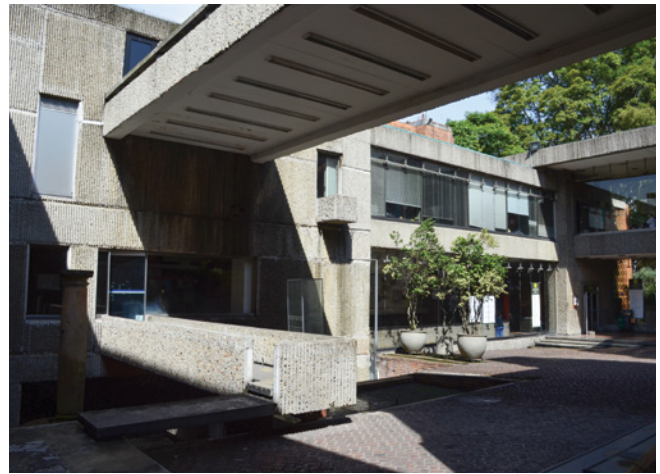
Edificio Pablo VI, sede de la Facultad de Artes hasta el 2015.