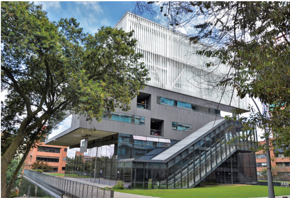
Edificio Gerardo Arango, S.J., actual sede de la Facultad de Artes.

La Facultad de Artes de la Javeriana celebra 25 años de una constante creatividad y exploración del mundo artístico.