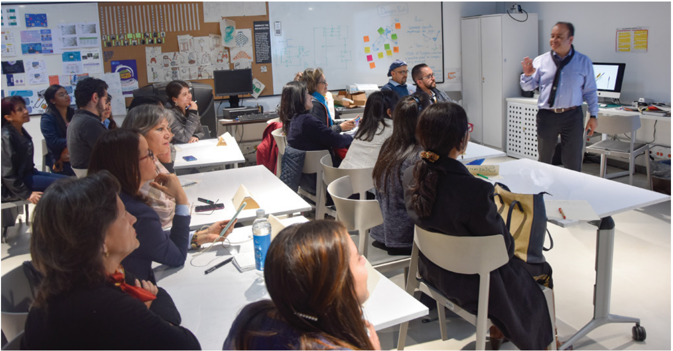
Actualmente, solo hay dos OTRI en el país, una en la Universidad de Antioquia reconocida en 2018 y ahora de la Universidad Javeriana, sede central.