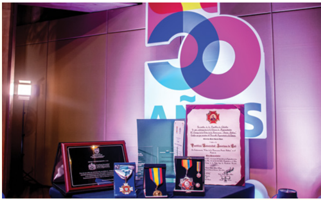
Condecoraciones entregadas a la Pontificia Universidad Javeriana, seccional Cali, por sus 50 años. Entre ellas una placa de la Alcaldía de Santiago de Cali y la condecoración Orden de la Democracia Simón Bolívar en el grado Cruz Comendador, de la Cámara de Representantes.

una sociedad aún en construcción, como el suroccidente colombiano.