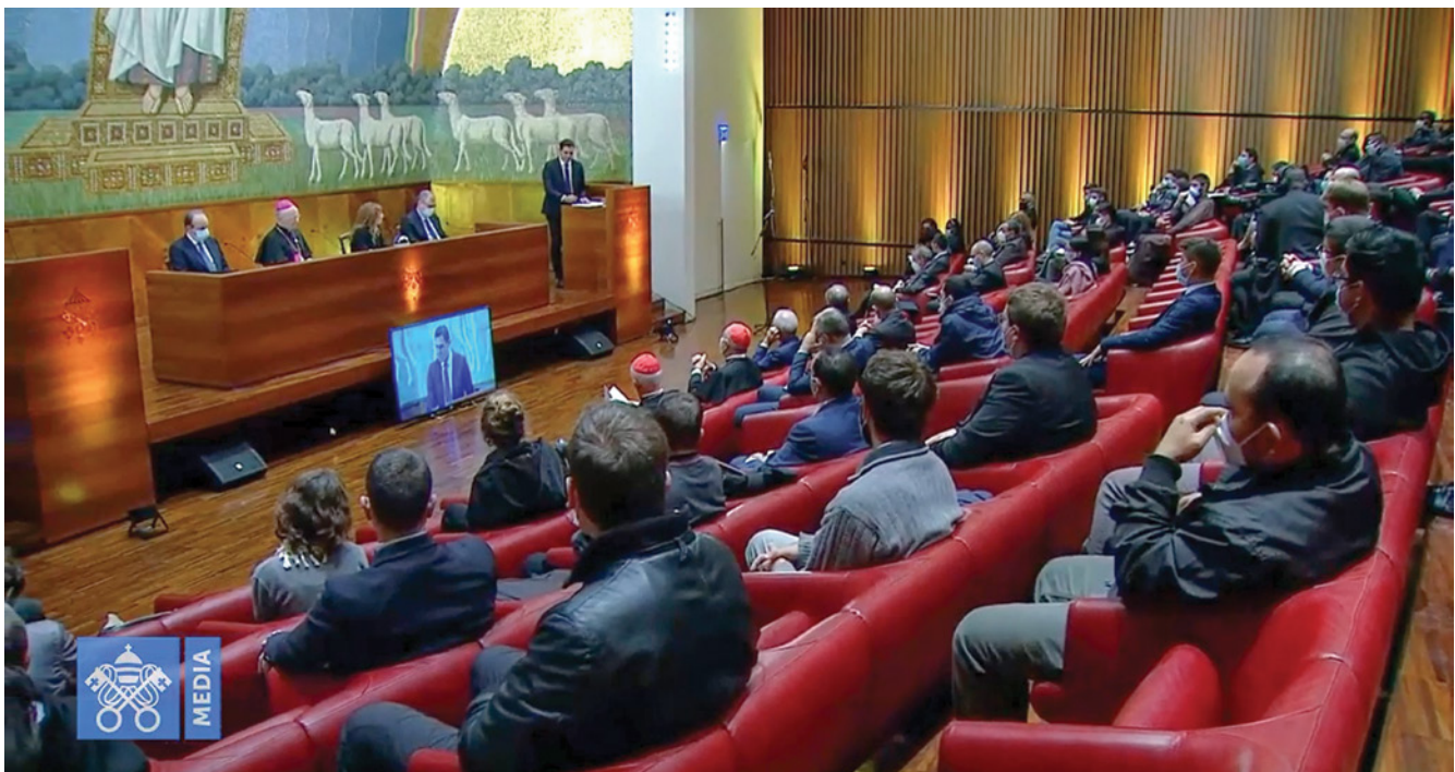
Pontificia Universidad Lateranense donde se hizo el anuncio del Pacto Global Educativo.

son: Sacro Cuore (Italia), Notre Dame (Estados Unidos) Universidad Católica de Australia (Australia) y la Pontificia Universidad Javeriana (Colombia).