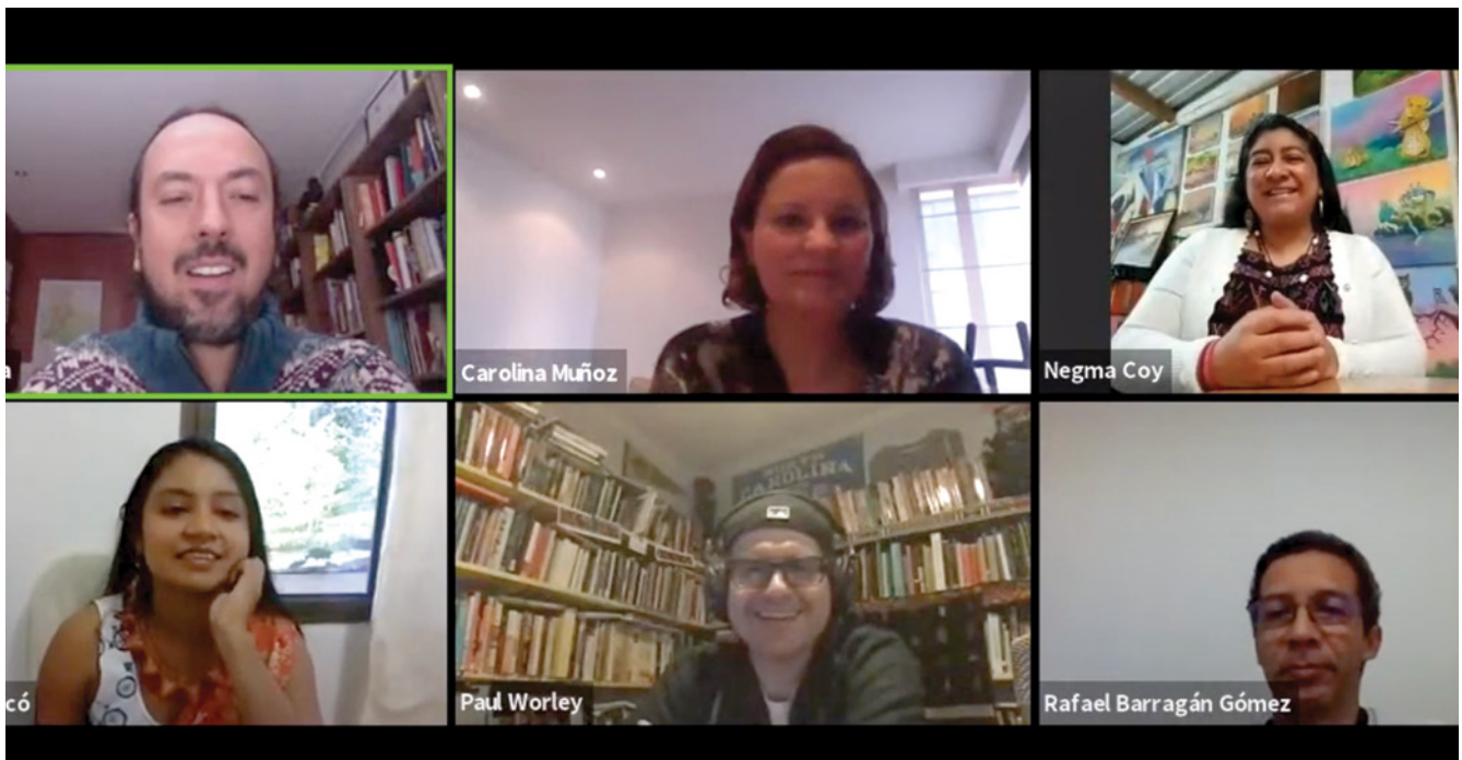
Conversación sobre Oralituras y escrituras afro e indígenas.