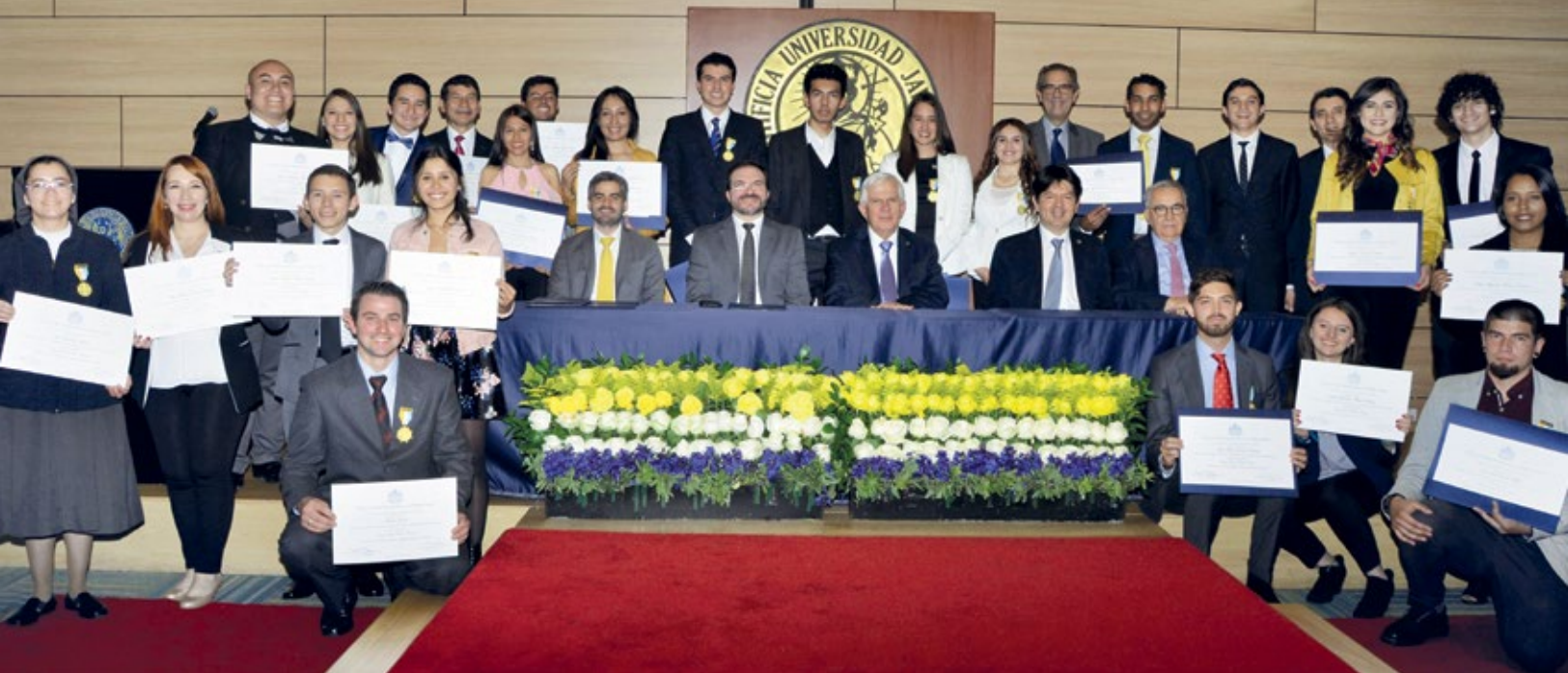
↑ La ceremonia de entrega de la Cruz San Pedro Claver se realizó el 1° de septiembre en el auditorio Alfonso Quintana, S.J.