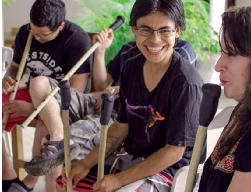
↑ El grupo institucional de Gaitas y Tambores, realizó un viaje de inmersión a San Juan Nepomuceno.

Cada grupo ensaya y trabaja con disciplina para presentar al público lo que practica en los talleres semanales. Al final la disciplina y rigurosidad de los profesores a cargo, recibe su recompensa en los reconocimientos que sus integrantes obtienen, no solo en la Javeriana, sino en diferentes partes del país a donde son invitados.