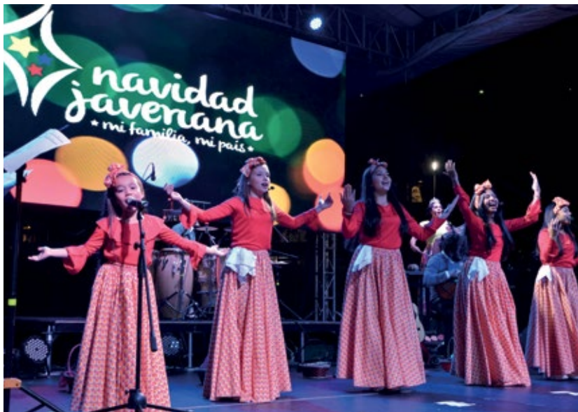
↓ Los niños invitados a la celebración de la Navidad en la Javeriana subieron al escenario a entonar la última canción del musical navideño.