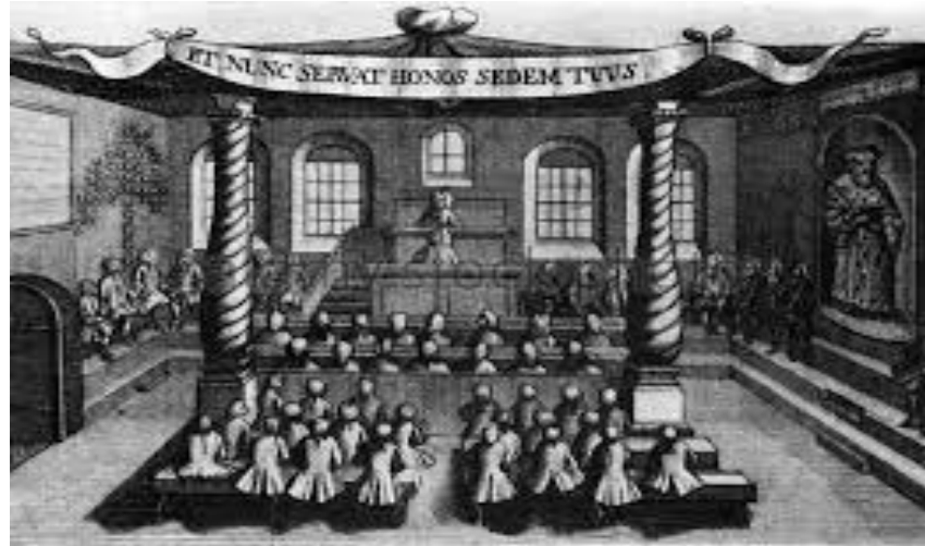
www.darby.com - FFYMA