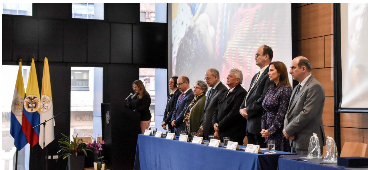
Ceremonia de premiación y clausura.

A lo largo de tres días de septiembre, el XVII Congreso La Investigación en la Pontificia Universidad Javeriana permitió compartir experiencias e ideas innovadoras, así como establecer o reforzar conexiones valiosas alrededor de nuevos proyectos conjuntos, para profundizar la diversidad, la colaboración y el impacto de las investigaciones javerianas.