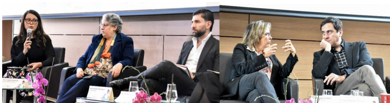
Conversatorio 'Ecología integral y generación de conocimientos'.

Dentro de nuestros compromisos institucionales, quisiera destacar dos elementos fundamentales que hemos abordado en nuestro Congreso: el primero, la ecología integral, y el segundo, la ética en la generación y transferencia de conocimiento.