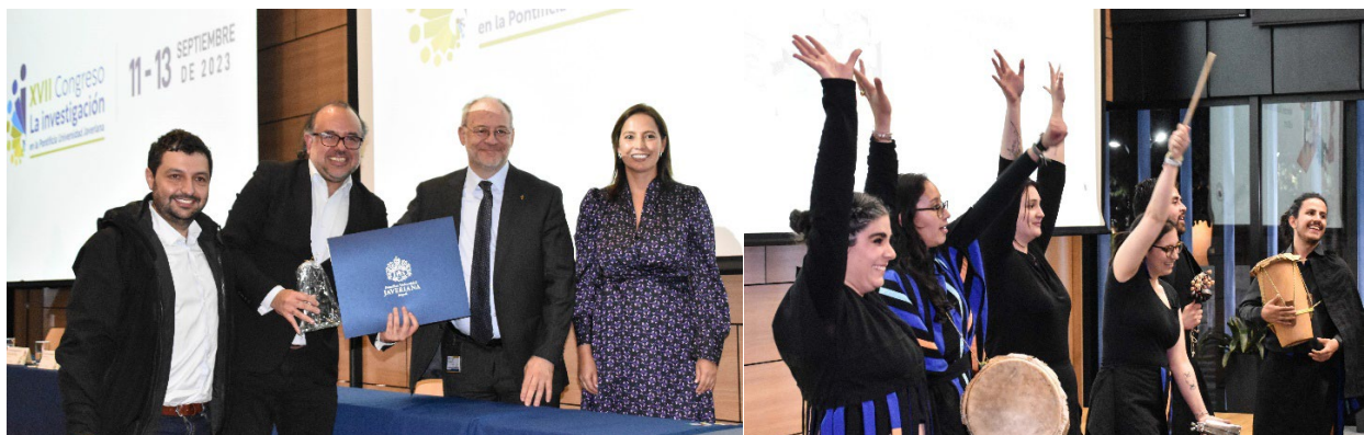
Ceremonia de premiación y clausura.

Es esencial continuar desarrollando buenas prácticas de gestión y valoración que consideren cuidadosamente las tres palabras: diversidad, colaboración e impacto. Es importante involucrar estrategias de abajo hacia arriba (bottom-up), que permitan incorporar formas de colaboración e impactos en función de las maneras en que se investiga en diferentes áreas del conocimiento para construir así un modelo propio de análisis de impacto. El propósito es potenciar los beneficios del conocimiento javeriano en diferentes ámbitos, así como ampliar y consolidar las alianzas y colaboraciones para la generación y transferencia de conocimiento con actores de la academia, la empresa, la sociedad, el Estado, nuestros egresados y las obras de la Compañía de Jesús a nivel local, regional, nacional e internacional. Juntos, todos nosotros miembros de la comunidad educativa, llevaremos a nuestra Universidad a nuevos niveles de impacto a gran escala.