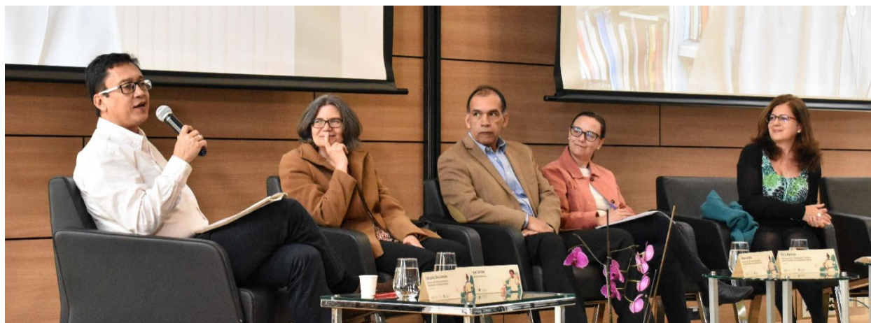
Conversatorio 'Ética en la generación y transferencia de conocimiento: aproximaciones desde diversas áreas'.

El conversatorio sobre la primera temática subrayó la potencia de este enfoque al destacar su capacidad para ilustrar las interconexiones de los problemas, abarcando diferentes dimensiones, desde la ambiental hasta la social. Enfatizó que este enfoque no se limita únicamente a las comunidades locales, sino que involucra a diversos actores, por ejemplo, las empresas, como elementos clave en el panorama. Evidenció cómo la noción de cuidado de la casa común se ha vuelto cada vez más relevante en los discursos y prácticas cotidianas de la comunidad javeriana. Nos plantearon una invitación a incorporar una ética del cuidado en nuestras investigaciones, con el propósito de que estas sean pertinentes, responsables y rigurosas. Finalmente, se nos alentó a involucrarnos en proyectos que exploren soluciones sostenibles en diversas dimensiones, y a asegurar que la ejecución de dichos proyectos sea en sí misma sostenible.