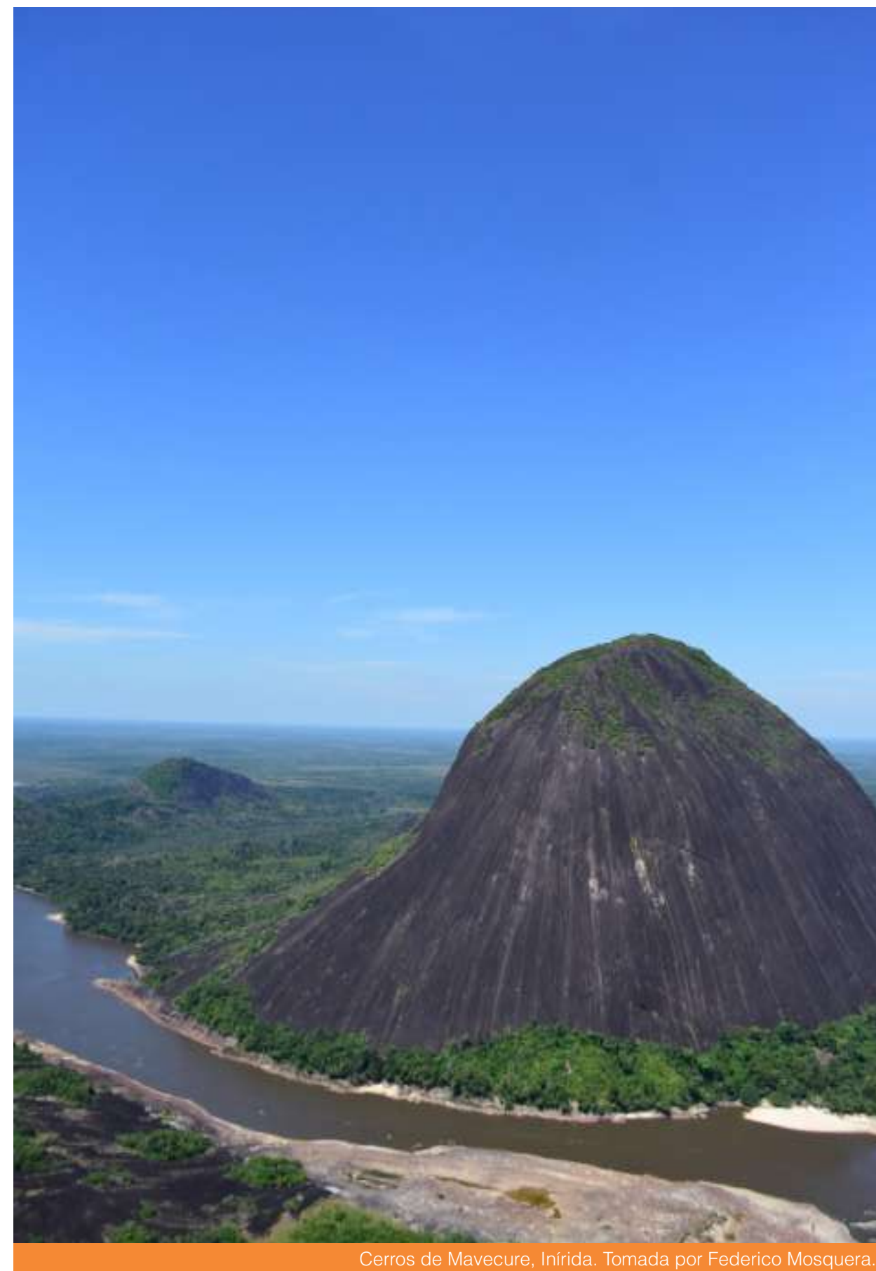
Cerros de Mavecure, Inírida.

La CJD&T está acompañando a las Juntas de Acción Comunal de las veredas, contexto que se encuentra en el área de traslape entre la ZRCG y el RI Nukak, específicamente en el proceso de restitución de tierras que se busca adelantar por parte de la URT. La estrategia jurídica se fundamenta en el derecho a la defensa y oposición del que gozan las familias campesinas que habitan en las veredas de traslape, y en la importancia de construir de la mano de las comunidades locales, respetando sus proyecciones territoriales, todas las intervenciones y acciones jurídicas.