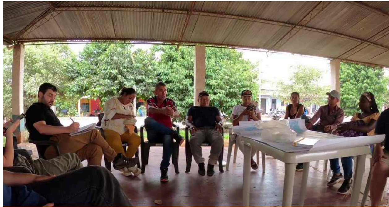
Viaje de la CJD&T a San José del Guaviare en alianza con CEALDES. Del 25 al 27 de febrero de 2023.