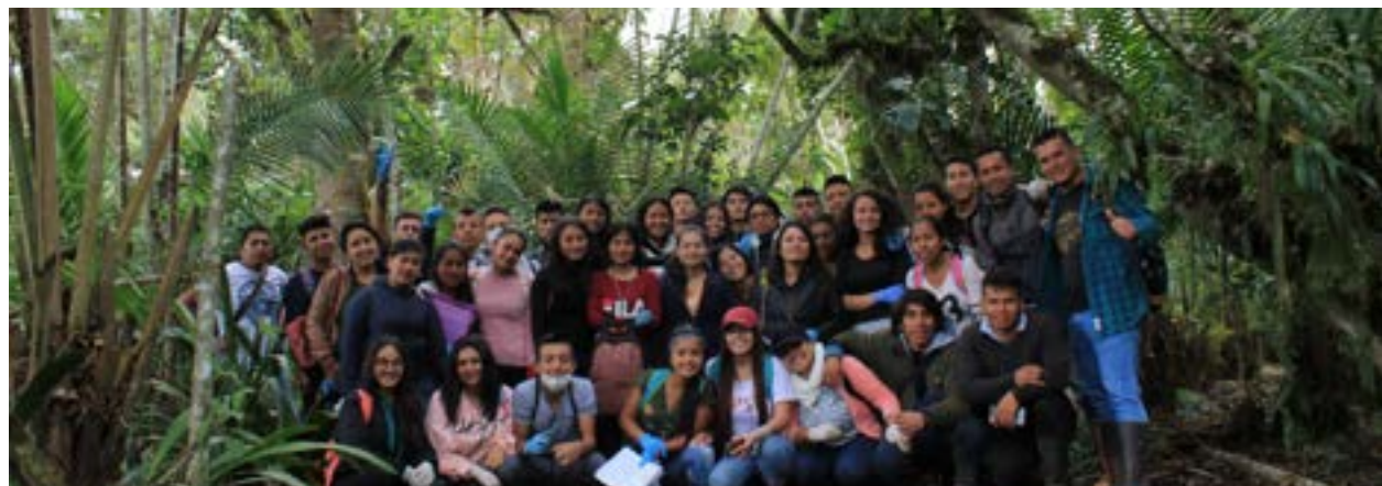
Sibundoy, Putumayo.