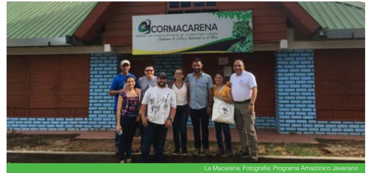
La Macarena.

Javeriano propició la formulación conjunta del proyecto “Derecho al agua y la alimentación en tres veredas del Municipio de La Macarena, Meta: diagnóstico, co-creación de alternativas y fortalecimiento de capacidades.