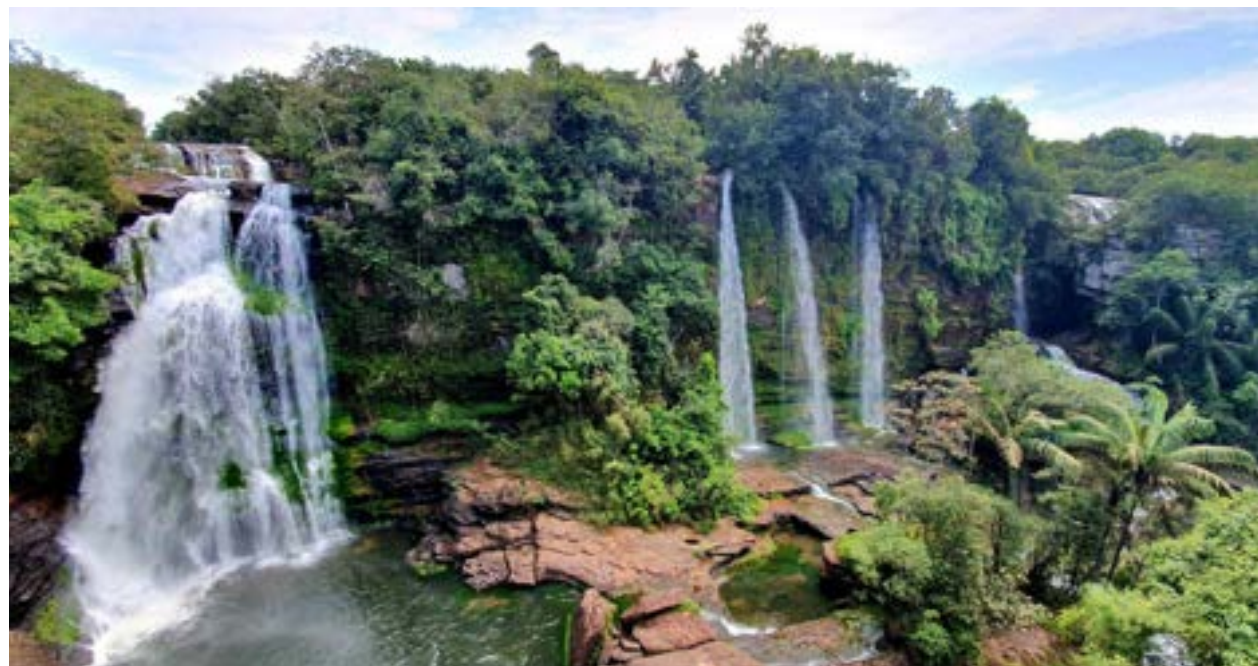
Cascadas Las Canoas-La Macarena.