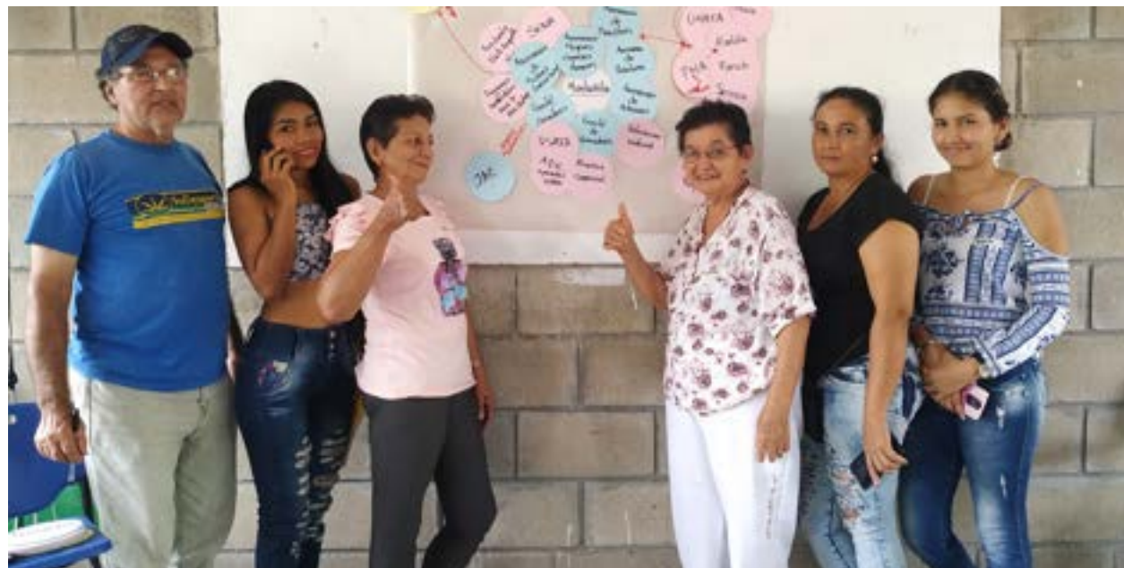
Montañita-Caquetá.