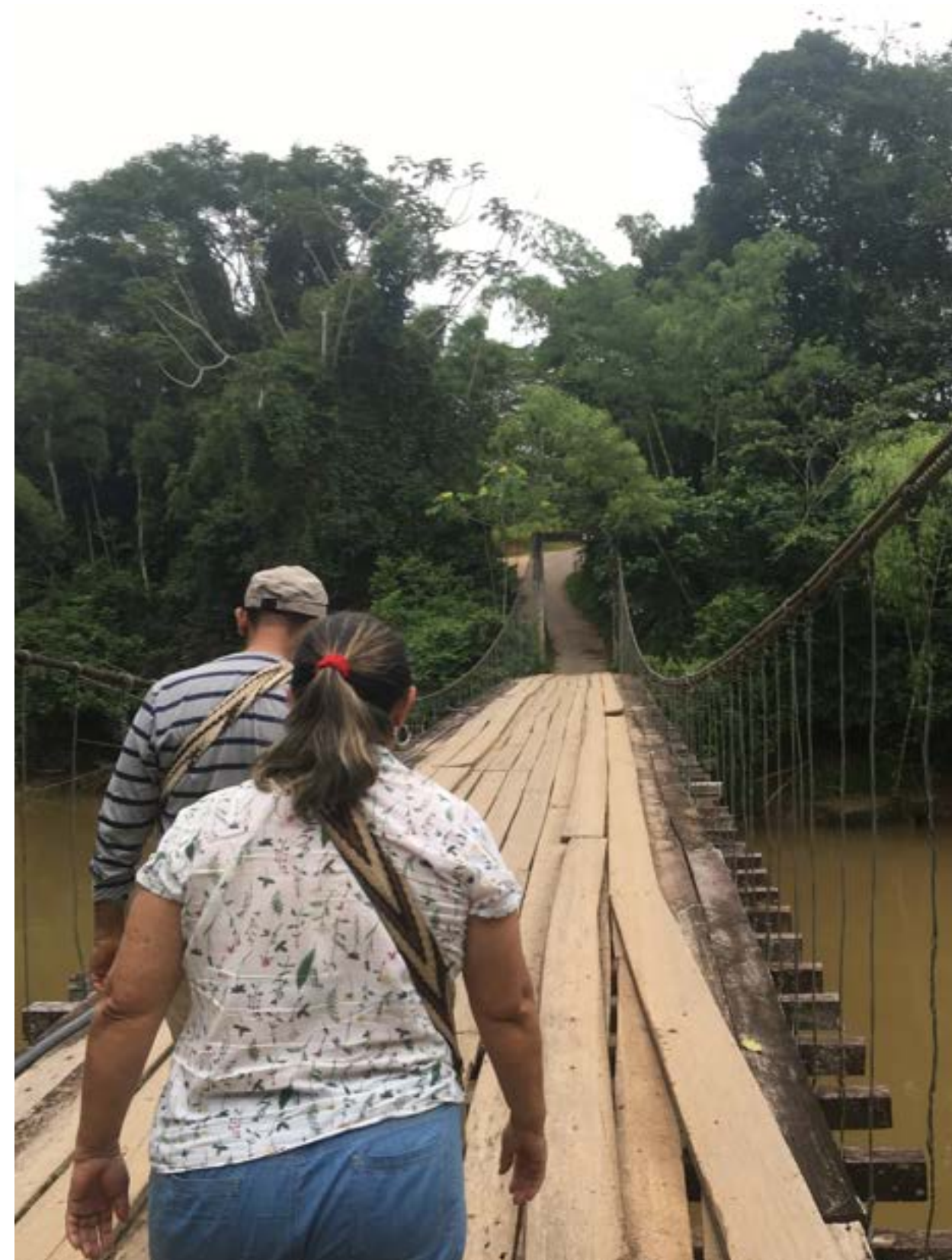
Puente. Camino a vereda El Rubí.

En la versión de 2019 de la Convocatoria San Francisco Javier fueron aprobados dos de los proyectos formulados en conjunto con el Programa Amazónico Javeriano (PAJ), en esta oportunidad, los investigadores centraron su interés en los derechos ambientales y en la recuperación del conocimiento ancestral etnobiológico.