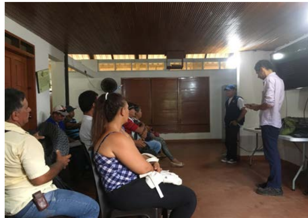
Taller Carlos Devia en La Macarena con Asopepro

Por lo tanto, el proyecto se propone caracterizar los bienes y contribuciones de la naturaleza de los ecosistemas presentes en los bosques, identificando especies arbóreas maderables y no made-