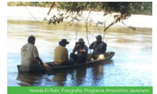
Vereda El Rubí.

asequibles desde la gestión comunitaria y el diseño e implementación de un plan de formación dirigido a personas de la comunidad, gestores de salud, miembros de los comités de salud de las Juntas de Acción Comunal, y las instituciones educativas de las tres veredas.