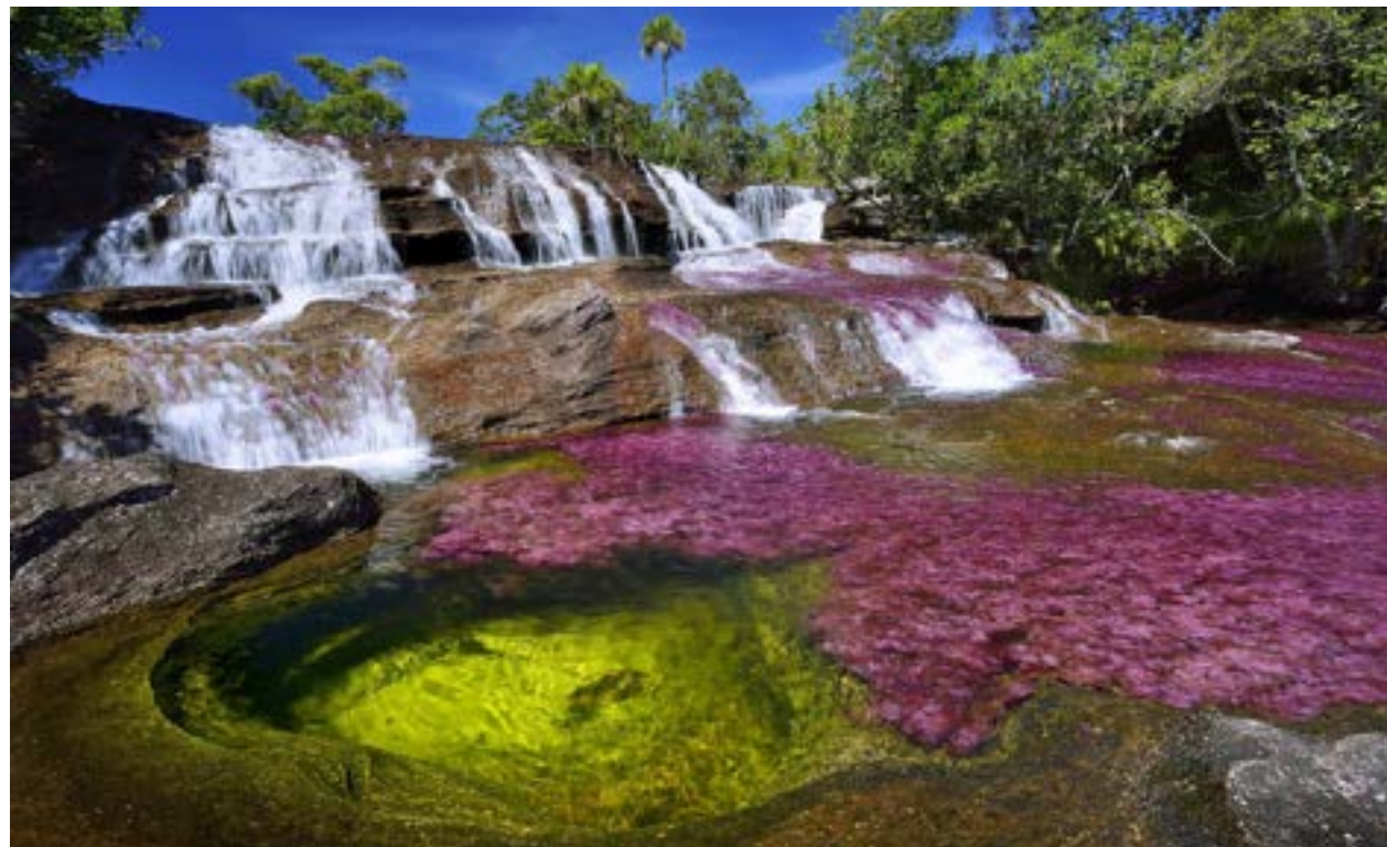
Caño Cristales la Macarena.

Teniendo en cuenta la trayectoria de la Universidad Javeriana, desde el Instituto de Salud Pública y el Doctorado en Ciencias Sociales en La Macarena (Meta) y San Vicente del Caguán (Caquetá), el Programa Amazónico