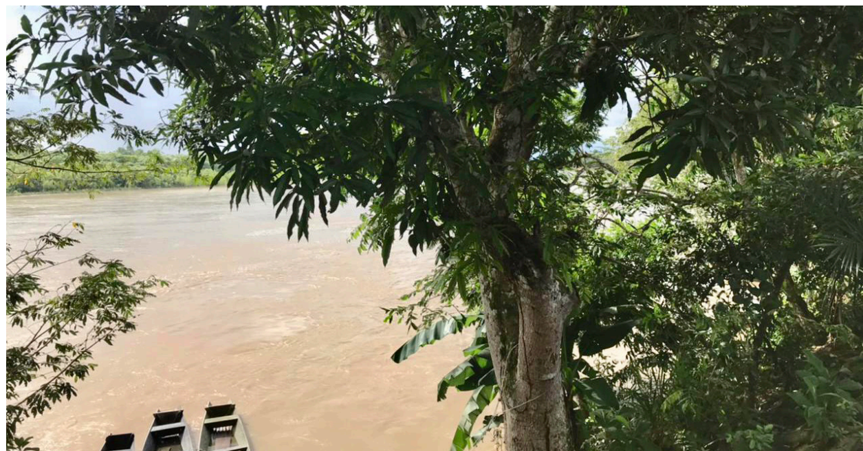
Río Guaviare.

El pueblo Jiw está compuesto por 2.200 personas aproximadamente*, está localizado principalmente en los Departamentos del Guaviare, Meta y Putumayo, y fue declarado en riesgo de extinción física y