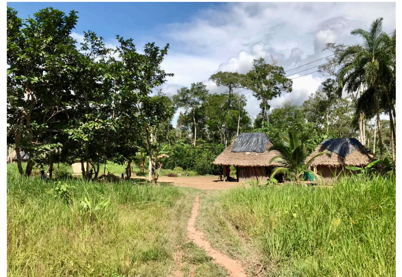
Asentamiento en uno de los resguardos de la comunidad indígena Jiw.

cultural por el Auto 004/2009 de la Corte Constitucional.