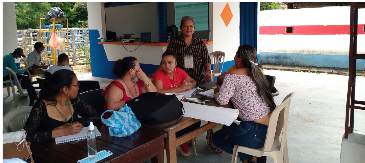
Proceso de formación en gestión sostenible del territorio. Montañita, Caquetá.

cimiento en la gestión sostenible del territorio; no obstante, se han encontrado con grandes desafíos, ya que los conflictos socioambientales por el uso del suelo y la deforestación creciente se han convertido en una realidad tangible en el posacuerdo. A esto se suma la falta de acompañamiento al sector agrario y los incentivos desacertados que no han permitido la integración los valores de la gran diversidad cultural y biológica del territorio en los procesos productivos y la toma de decisiones.