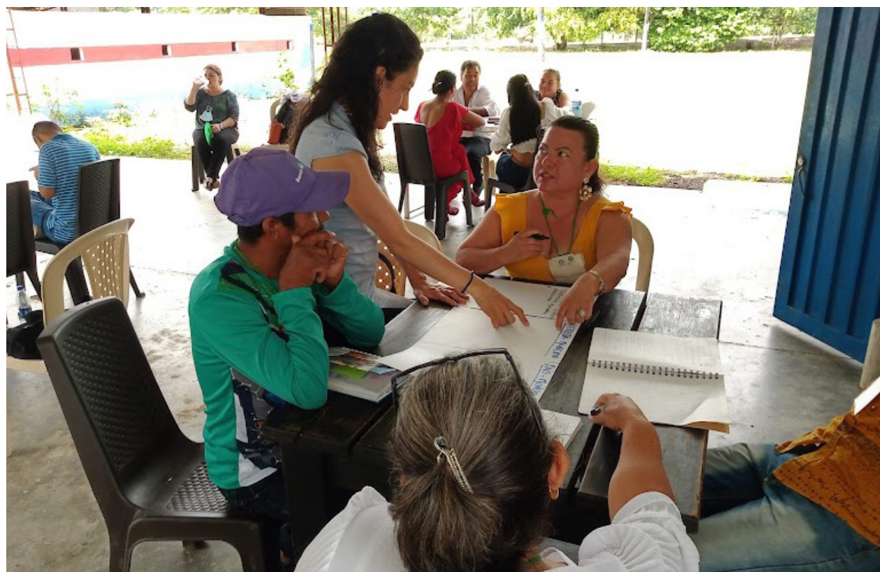
Talleres sobre gestión sostenible del territorio.

texto del posconflicto en La Montañita, Caquetá y el Carmen de Bolívar, Bolívar”, financiado por la Vicerrectoría Académica, se profundizaron los lazos con las comunidades del Carmen de Bolívar y La Montañita Caquetá. En el marco de este proyecto surgieron las necesidades de fortalecimiento de capacidades, que las organizaciones de Montañita hicieron explícitas y que permitieron la búsqueda de nuevos recursos para su realización.