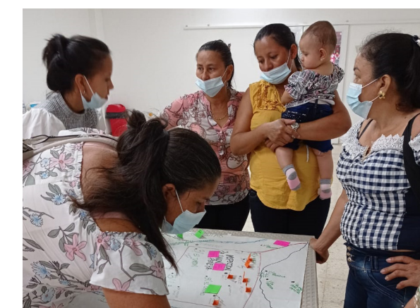
Réplicas de talleres por parte de mujeres en la inspección de la Unión Peneya-La Montañita

Como resultado de esta de experiencia y del interés genuino de las comunidades de la Montañita y de Agrosolidaria, estas han propuesto diseñar un nuevo proceso de formación de forma conjunta que dé continuidad al fortalecimiento de las capacidades locales para la gestión sostenible del territorio. Lo anterior, debido lo enriquecedor que es el trabajo conjunto entre organizaciones sociales y la Pontificia Universidad Javeriana para la co-construcción de conocimientos y reflexiones para la apropiación y defensa de un territorio que les permita garantizar una vida digna, una buena vida, para sus familias y las futuras generaciones.