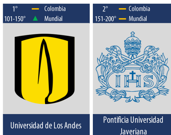
Diagrama 2: Posiciones de las mejores universidades en Colombia que ofrecen carreras relacionadas con el área de conocimiento “Filosofía”.