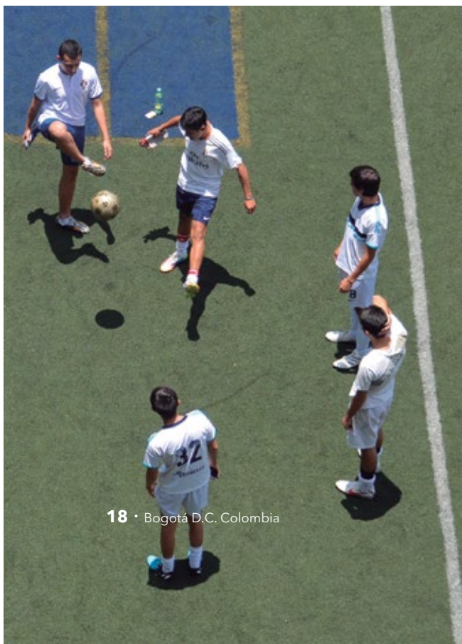
18 • Bogotá D.C. Colombia

El Centro Javeriano de Formación Deportiva ofrece espacios para desarrollar actividades físicas y deportivas. Está disponible de domingo a domingo en horarios extendidos y tiene excelentes escenarios y equipos de última tecnología. Su sistema deportivo permite que cualquier estudiante pueda hacer parte de las 120 selecciones de facultad de la Universidad o de las selecciones Javerianas que han ganado los torneos regionales por más de 6 años y participan con éxito en los Juegos Nacionales Universitarios.