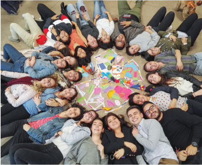
Participantes del programa AHIMSA

Otro de los caminos que decidió recorrer la Universidad en 1995 fue a través de la creación de un Programa que se ocupara, inicialmente, de sensibilizar a la comunidad universitaria sobre la problemática que estaba viviendo el país para que, además de estudiar y comprender el fenómeno, nos sintiéramos responsables y fuéramos haciendo la construcción de paz parte de nuestro proyecto ciudadano. Y para crear un puente entre la comunidad educativa y el movimiento ciudadano que impulsaba la Semana por la Paz.