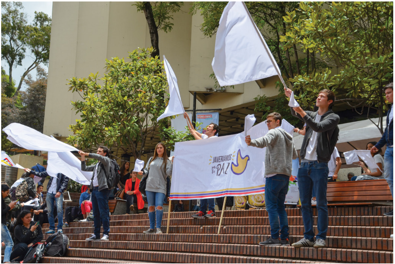
Más de 600 javerianos han participado en algunos procesos de formación del Programa Cultura para la Paz.