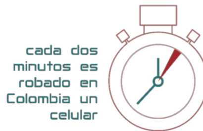
Figura 1. Número de robos

Objetivo: Entender y caracterizar el hurto de celulares en Colombia, para la prevención del delito.