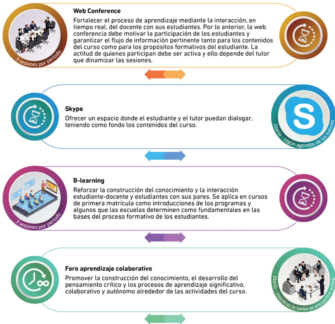
Figura 1. Infografía sobre herramientas pedagógicas comunicativas (parte I).