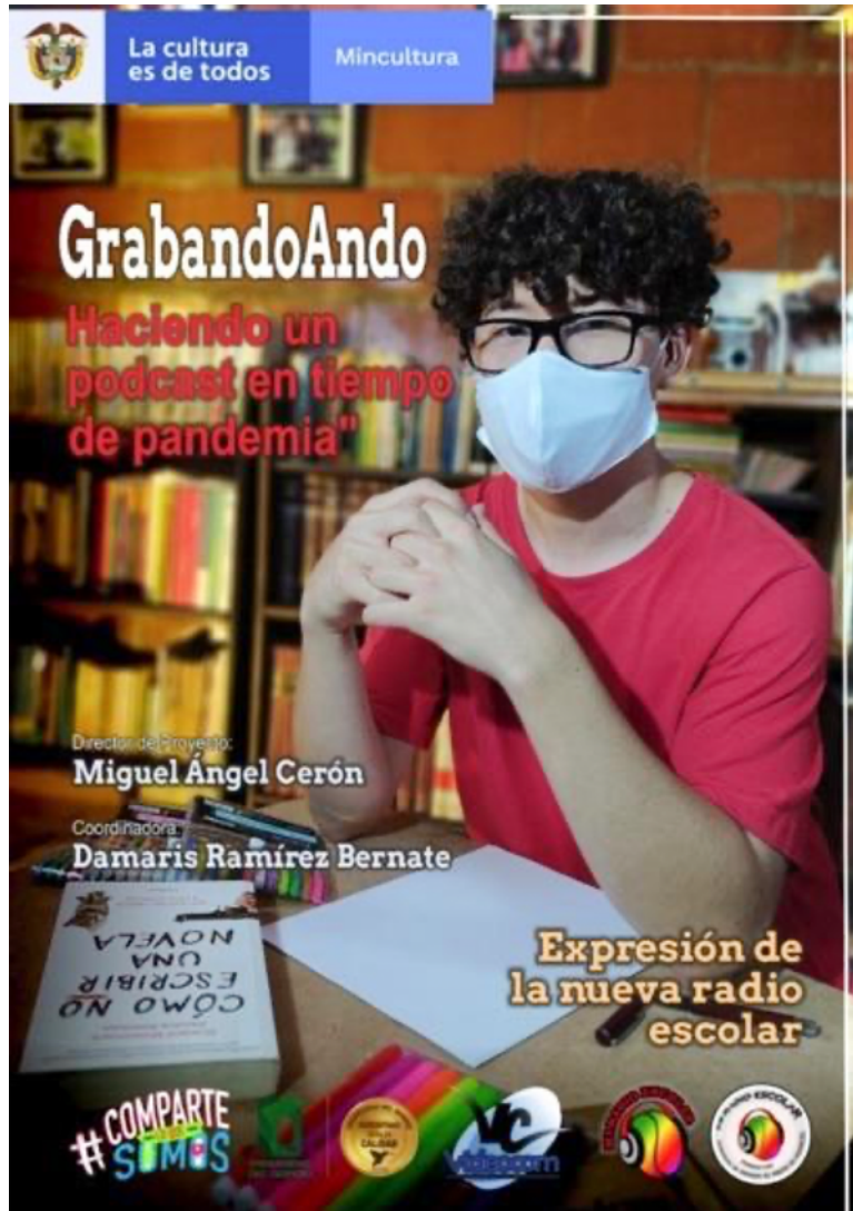
Figura 1. Título de las Memorias: GrabandoAndo, haciendo un pódcast en tiempos de pandemia.