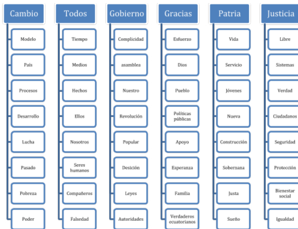
Grafico 1. Categorías y subcategorías de análisis

Elaboración Andrea Angulo. Fuente: Consulta por búsqueda de palabras en Nvivo