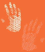
Gráfico 3. Gobierno y Asamblea (Fractal Margarita)